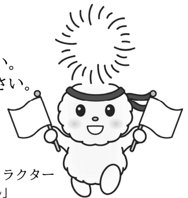
朝霞市キャラクター 「ぼぼたん」